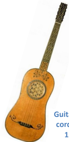
Guitare à 5 cordes de 1590

Durant la seconde moitié du XVIIIème siècle, la pratique de la guitare va connaître un regain de popularité. L'ajout d'un sixième chœur, le passage aux six cordes simples, le remplacement des frettes de boyau par les frettes d'ivoire, d'ébène, puis de métal, ont fait évoluer la guitare vers une sonorité de plus en plus semblable à celle de la guitare classique que nous connaissons aujourd'hui.