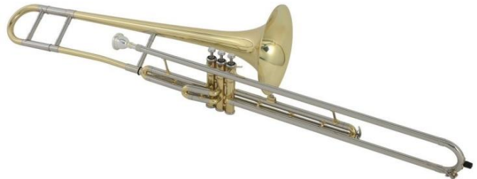
Trombone à pistons