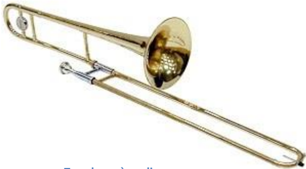
Trombone à coulisse

En Europe, on utilise le plus souvent le trombone à coulisse caractérisé par l'utilisation d'une coulisse télescopique, mais il existe également des modèles de trombone à pistons.