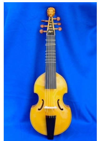
Une viola da braccio

Il semble que les premiers violons aient emprunté des caractéristiques à chacun de ces instruments à cordes.